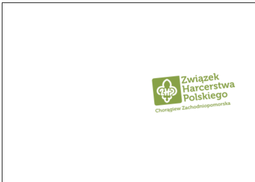
Legitymacja odznaki “Zasłużony Instruktor Chorągwi Zachodniopomorskiej ZHP” - okładka